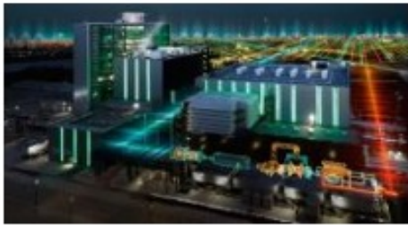
Gas and Power

Siemens: une organisation très « verticalisée » et des entités très autonomes