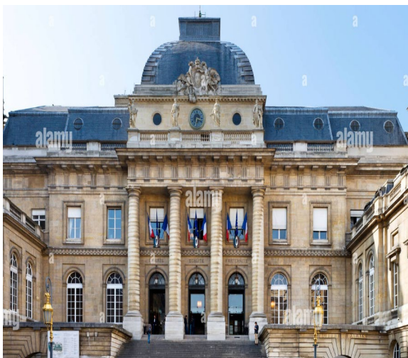
La cour du Mai, entrée principale du Palais de la Cité

Le Palais de Justice aujourd'hui : le Palais de Justice regroupe la Cour d'appel et la Cour de cassation . Auparavant situé dans le Palais de Justice, le Tribunal de Grand Instance a déménagé dans l'immense bâtiment de la Porte de Clichy à Paris construit à côté de la ZAC Clichy-Batignolles.