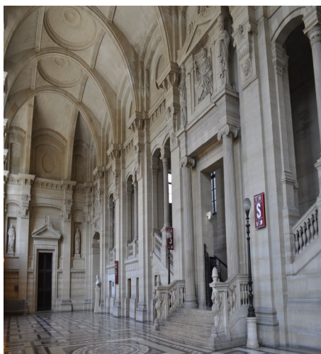
Hall de Harlay